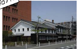
島津製作所 創業記念資料館

島津製作所が約140年前から作ってきた理科の実験道具やレントゲン装置、マネキンなどを展示。実験コーナーでは科学の不思議とおもしろさも体験できます。