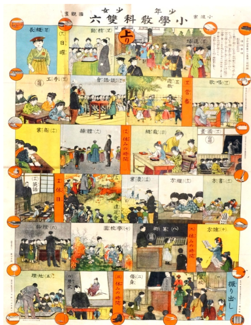
めいじ じだい 明治時代のすごろく