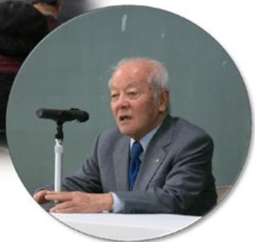
うえむら あつし 上村 淳之

日本画家・京都市学校歴史博物館 館長 1933年京都市中京区に生まれる。京都市立美術大学（現京都市立芸術大学）専攻科を修了。1992年京都府文化功労賞受賞。1995年日本芸術院賞受賞。1999年京都市文化功労者。松柏美術館館長。京都市立芸術大学 元副学長・名誉教授。日本芸術院会員。劇画会理事長。2013年文化功労者。