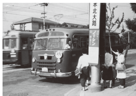
スクールバスに乗車(1958年,呉竹養護学校)