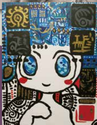
天才アート作品「ひみこ」 (山元真菜子・東総合支援学校高等部3年, 2015年)