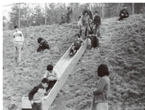
運動場東側のすべり台(1976年,東養護学校)