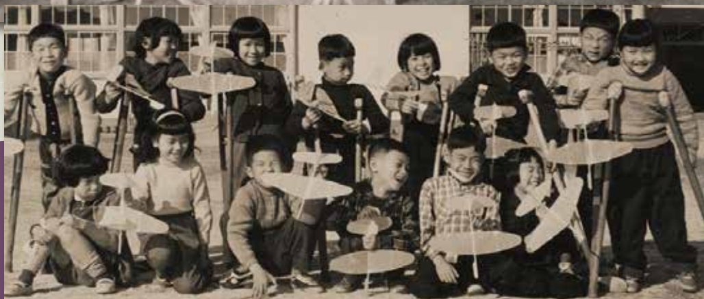
竹ひごで作った飛行機を持って (呉竹養護学校, 1960年)

開館時間：午前9時～午後5時（入館は午後4時半まで） 休館日：毎週水曜日（祝日の場合は翌平日）、12月28日～1月4日 入館料：大人200円 小・中・高生100円