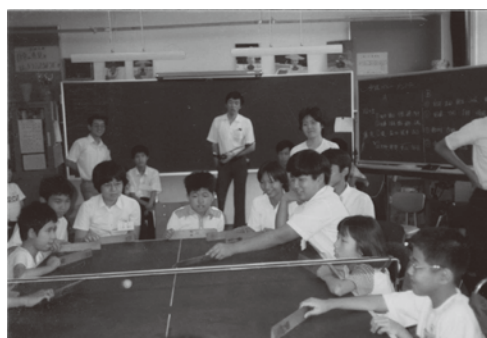
双ヶ丘中学校生との交流会で卓球バレー(1978年,鳴滝養護学校)