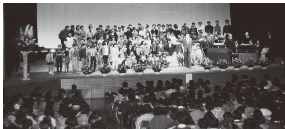
京都公会館での合同音楽発表会(1970年,呉竹養護学校)