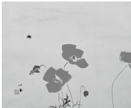
竹内栖鳳《虞美人草》大正9年 京都市学校歴史博物館蔵