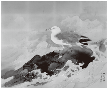
橋本関雪 《波にかもめ》 元教業小学校蔵

日本美術の歴史の中で、画家たちが大切にしてきたことがあります。それは「余白」に詩情を込める、ということです。背景を細密に描きこみ、科学的な目で空間を再現することが多かった西洋の表現とは異なり、日本の絵画は「描かない」余白に大きな意味を込めて、空間の「遠さ」や「広がり」などを表現します。それが日本画独特の詩情を生み、鑑賞者は吸い込まれるように絵の世界に誘われるのです。この展覧会では「余白の美」をテーマに近代の日本画を紹介し、日本画が織り成す空間の美しさを改めて見直します。