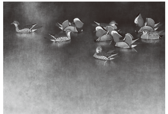
上村松篁《鴛鴦》昭和40年 松伯美術館蔵