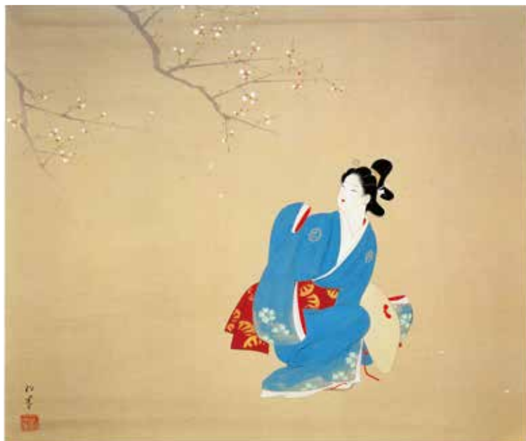
上村松園 《春の旅》 昭和14年 松伯美術館蔵（後期展示）