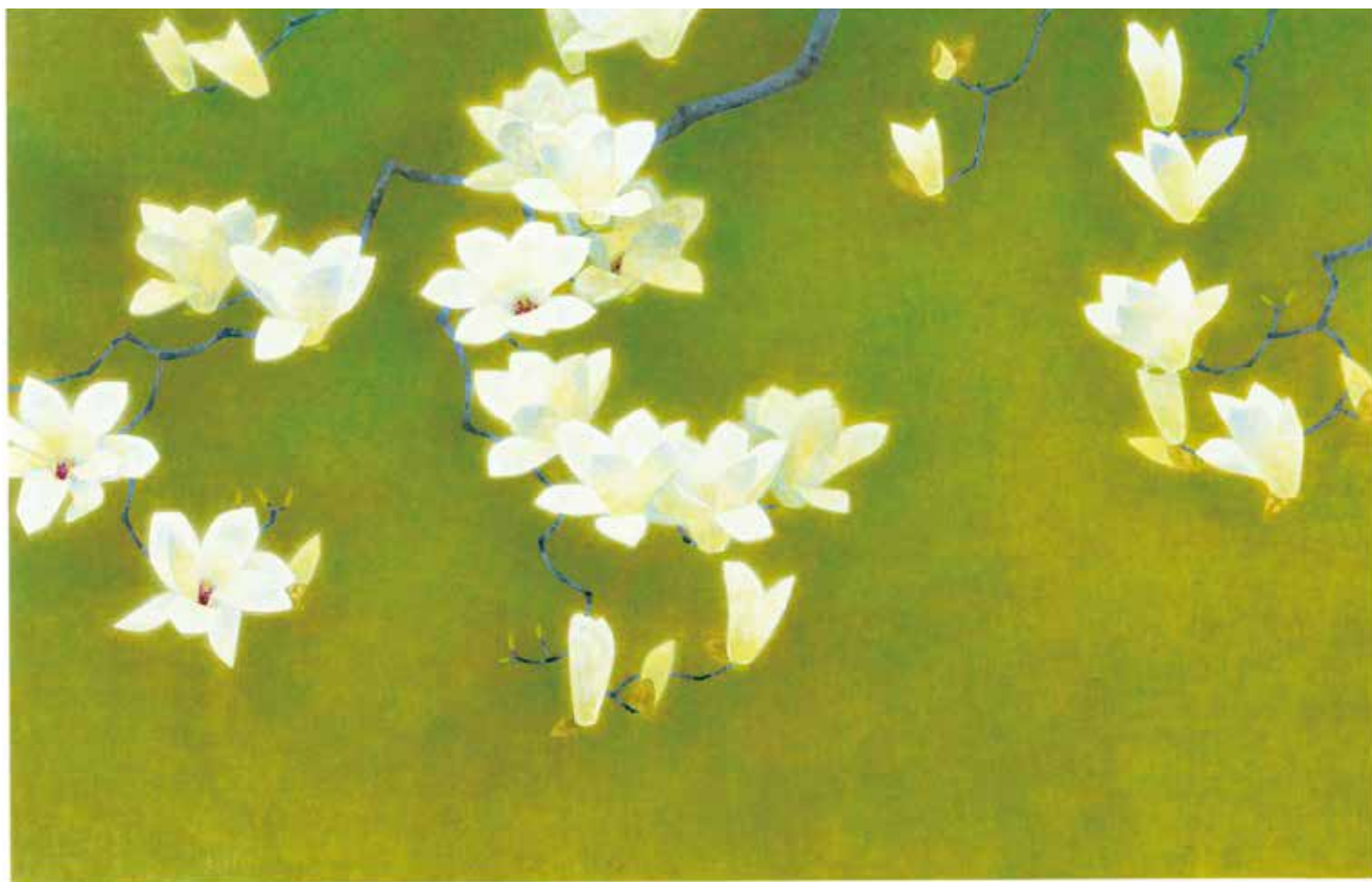
上村松篁 《白木蓮》 昭和50年 松伯美術館蔵