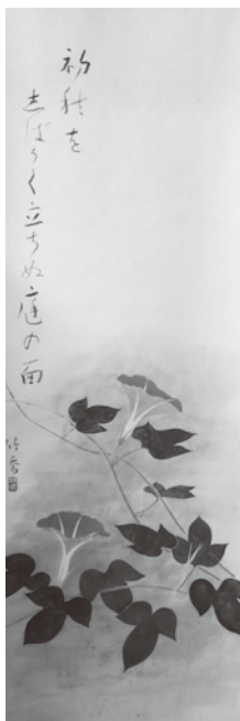
小野竹喬 《初秋を志ばらく立ちぬ庭の面》 個人蔵（後期展示）