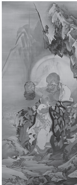
久保田米僊《因掇陀尊者図》明治30年