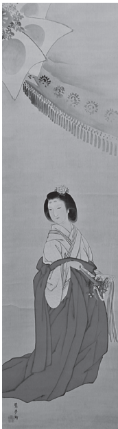
幸野樗嶺《女官図》明治40年 京都府立総合資料館蔵 (京都文化博物館管理)【後期展示】