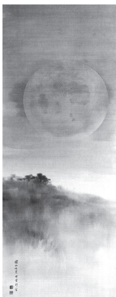
岸竹堂《円山吐月之図》明治期 京都・天寧寺蔵