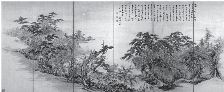
田能村直入《嵐山春景・流野川秋景図》(部分) 明治15年【後期展示】