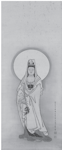
巨勢小石《白衣観音図》明治45年