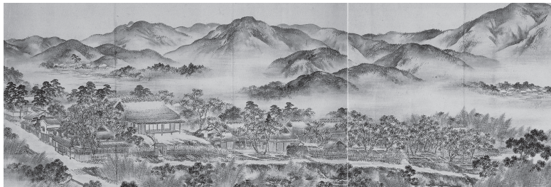
幸野樗嶺《岩倉公旧蹟春秋図》(部分) 明治期 京都市歴史資料館蔵【前期展示】