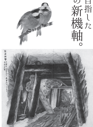
田村宗立《琵琶湖疏水工事図巻》(部分) 明治18-23年 京都市上下水道局蔵