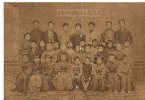
卒業写真 玄武尋常小学校 明治22(1889)年