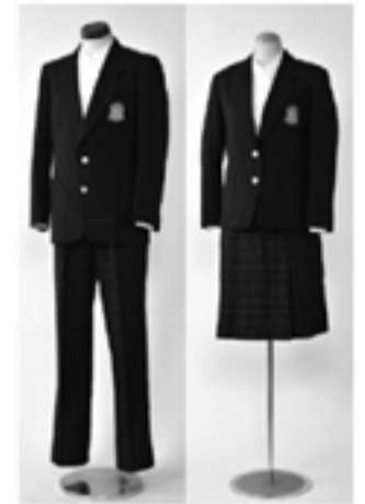
1990年代半ば以降の制服 (村田堂 蔵)