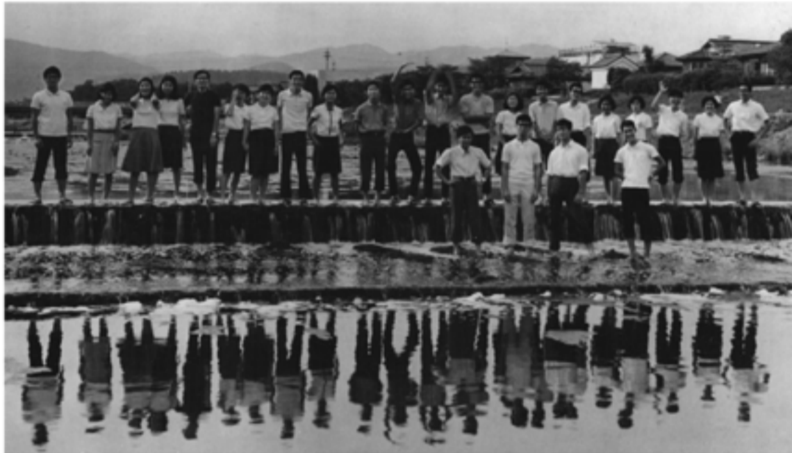
1967(昭和42)年 鴨川で記念写真(京都市立高校)