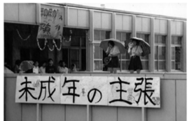
1999(平成11)年 未成年の主張(京都市立高校)