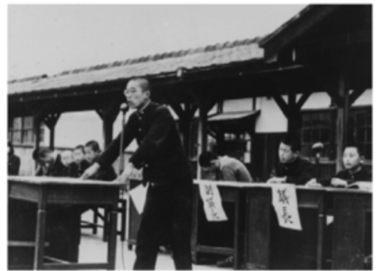
1952(昭和27)年 生徒大会(京都市立中学校)

本展では、京都市内の中学・高校生活を舞台に、戦後から近年までの「青春」にちなんだ資料を展示いたします。青春時代の一コマを記録した写真を中心に、制服や教科書、文集などを通して、「青春」とは何なのか、中学・高校生活とは何なのか、思いをめぐらせていただくと幸いです。