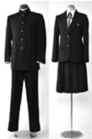
1980年代の制服 (村田堂 蔵)