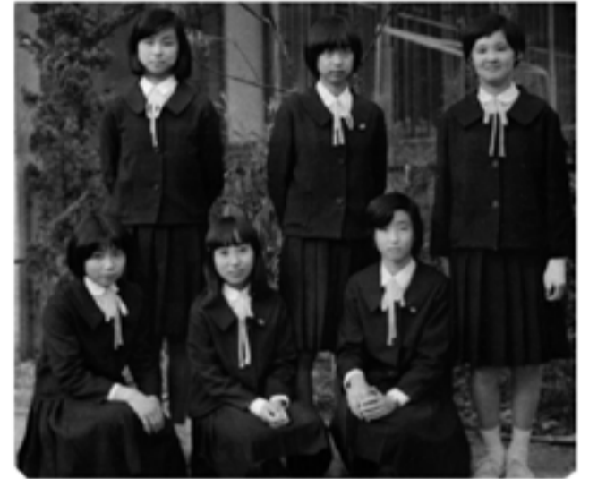
1972(昭和47)年 初期のブレザー制服(京都市立中学校)