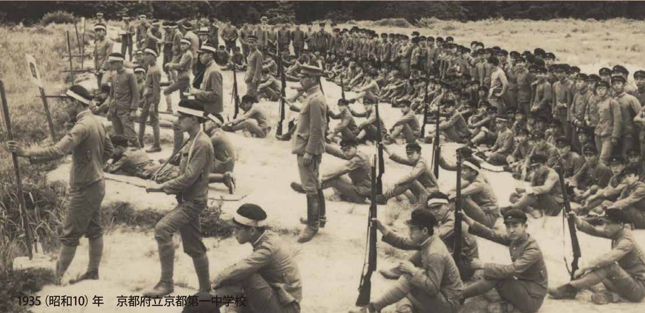
1935 (昭和10) 年 京都府立京都第一中学校

2018 (平成30) 年 12月15日 (土) ~ 2019 (平成31) 年 3月24日 (日)