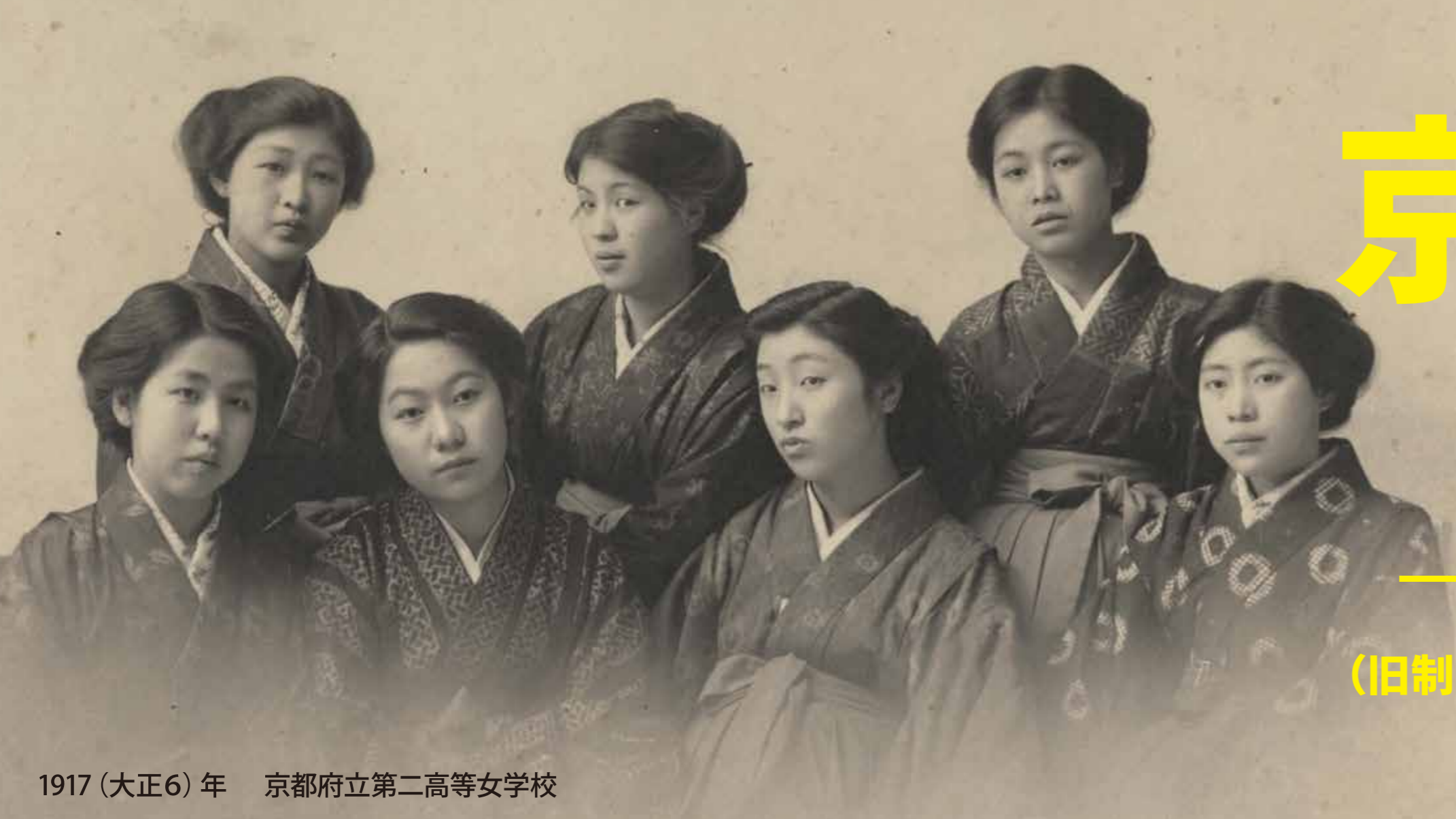
1917 (大正6) 年 京都府立第二高等女学校