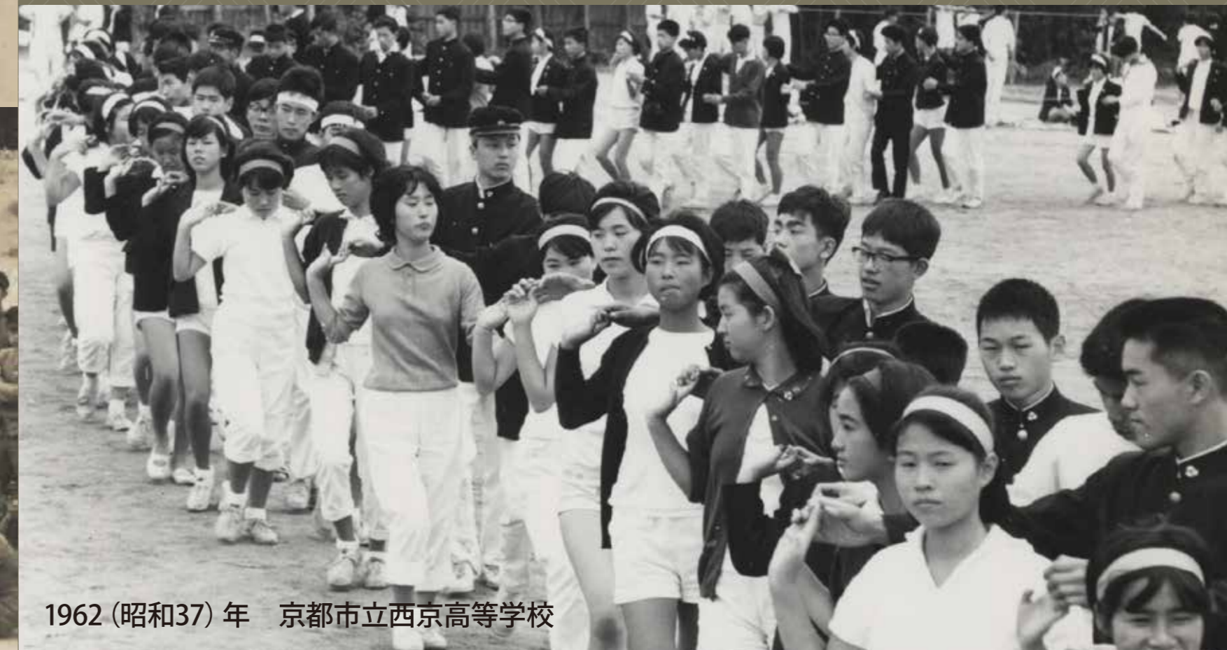
1962 (昭和37) 年 京都市立西京高等学校