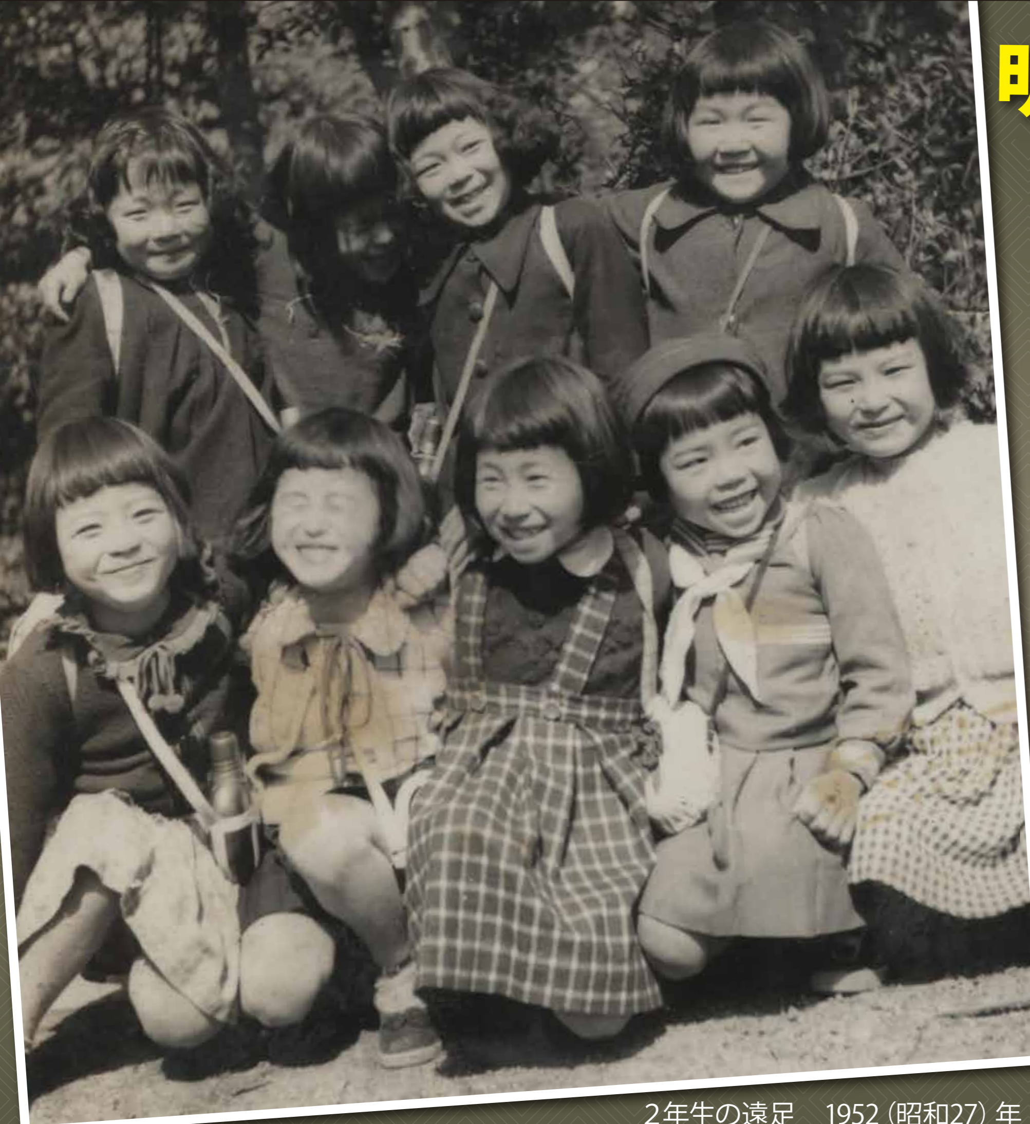
2年生の遠足 1952 (昭和27) 年