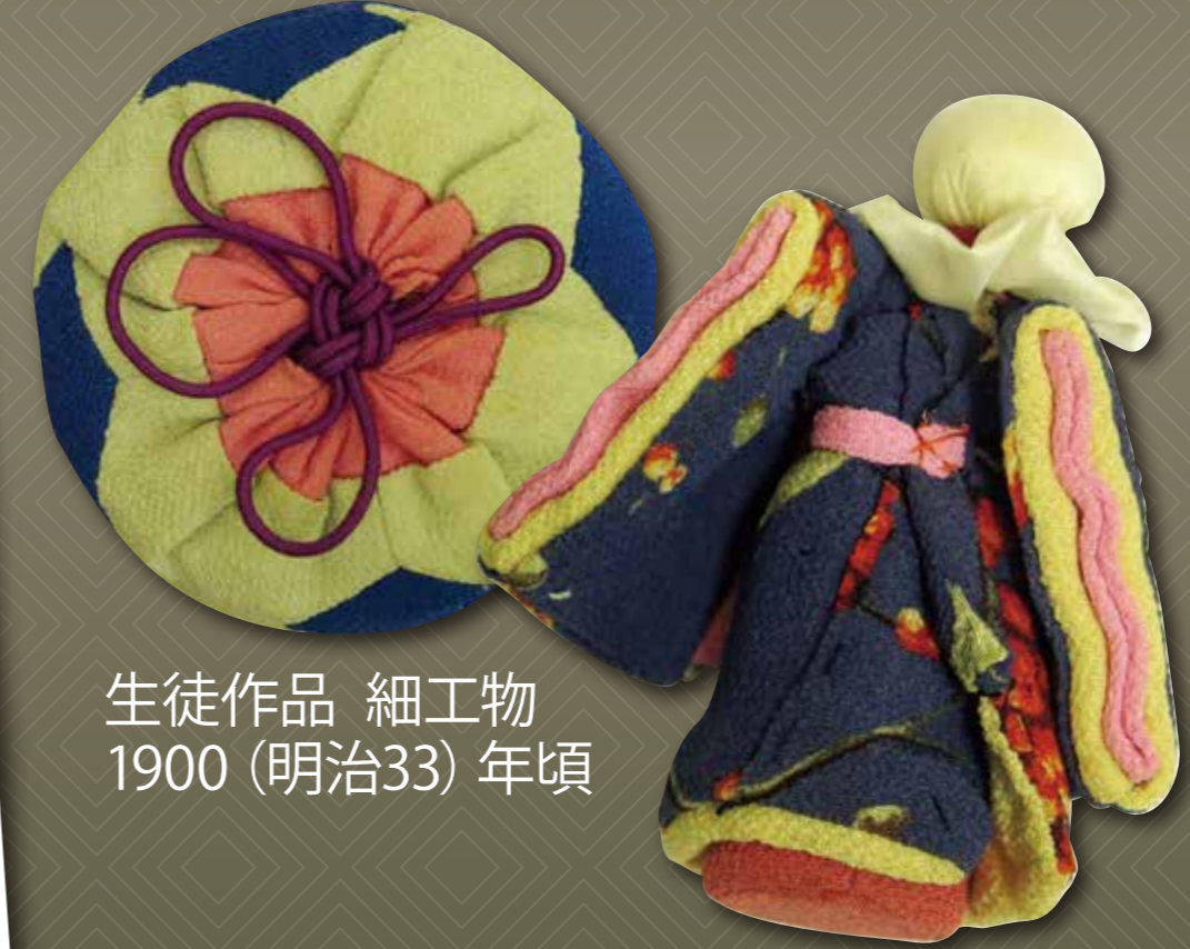
生徒作品 細工物 1900 (明治33) 年頃