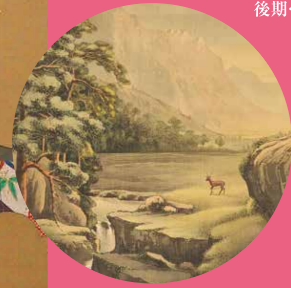
左：今尾景年《深山溪流図》(部分) 明治初期

前期…4月28日(土)～5月15日(火) 中期…5月17日(木)～6月5日(火) 後期…6月7日(木)～6月19日(火)