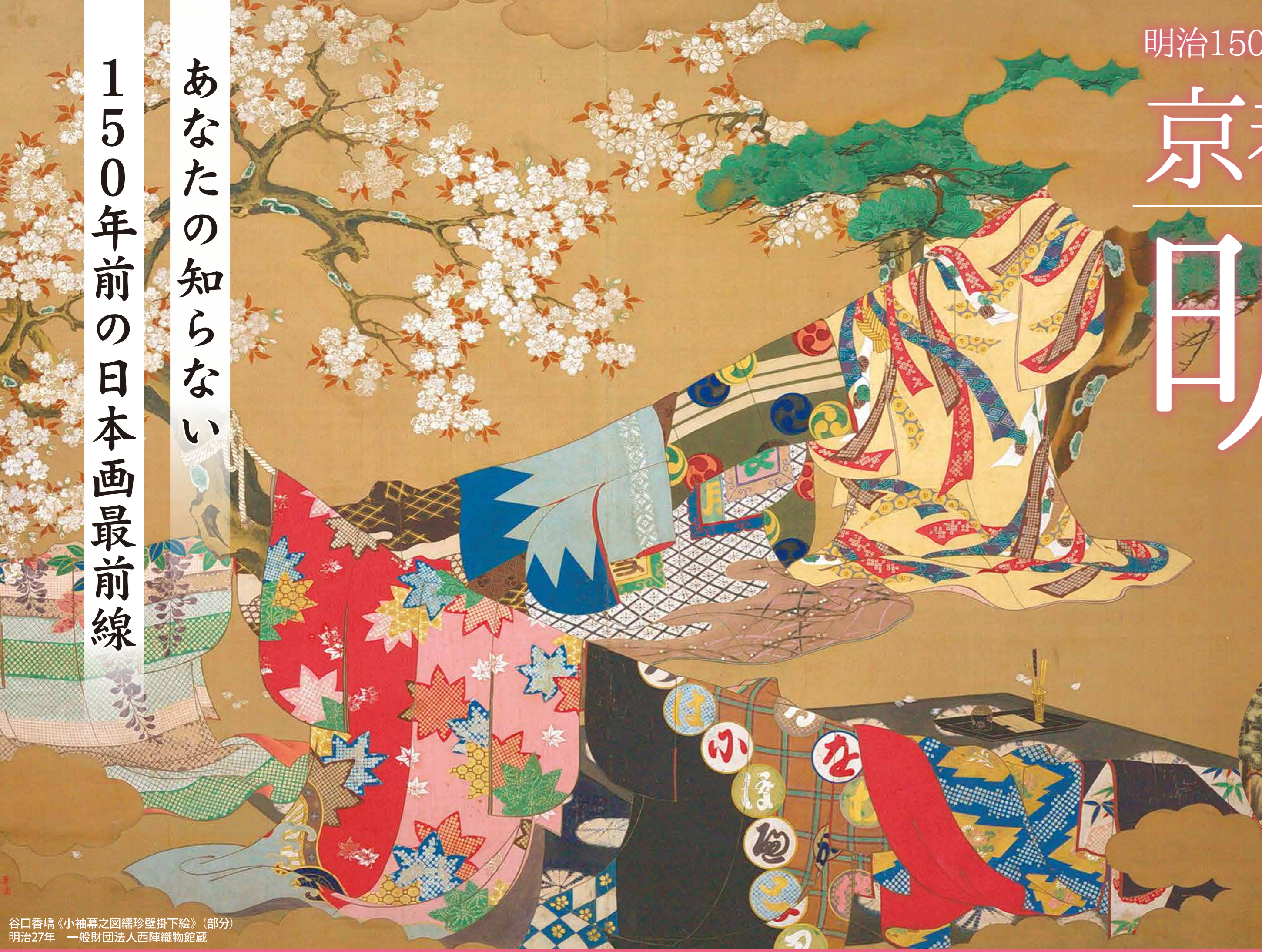
谷口香嶠《小袖幕之図繡珍壁掛下絵》(部分) 明治27年 一般財団法人西陣織物館蔵