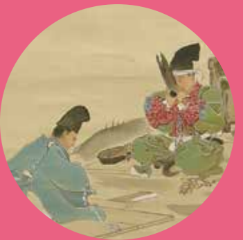
右下：久保田米僊《源義光図》(部分) 明治20年代