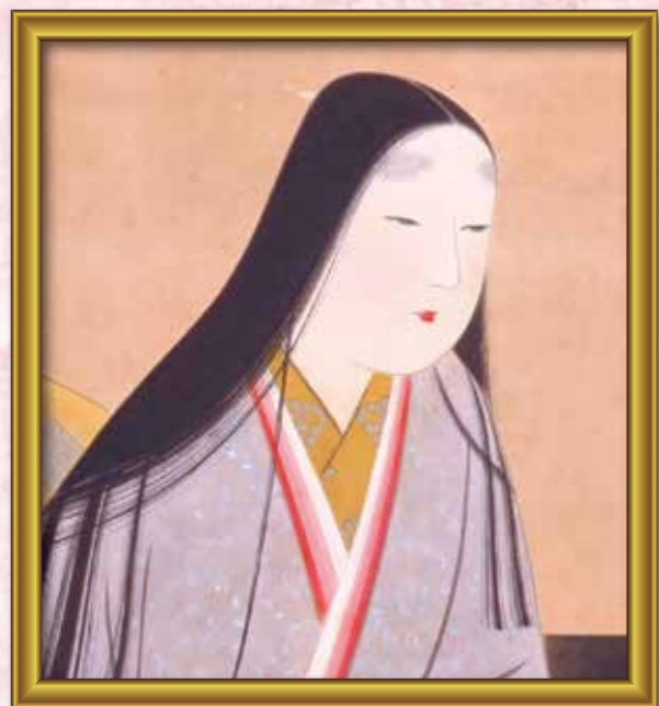
③ 紫 ○○ 『源氏物語』を書きました。