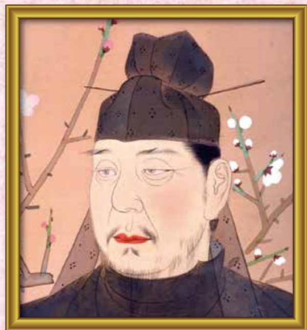
④ ○原 ○真 学問の神様です。