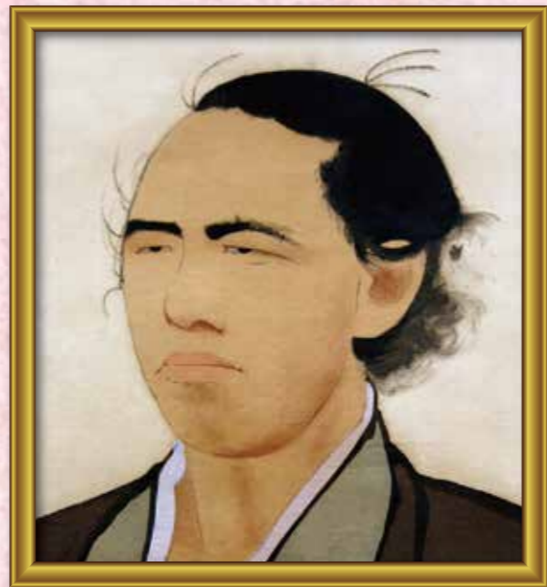
② 坂○龍○ 幕末の志士です。