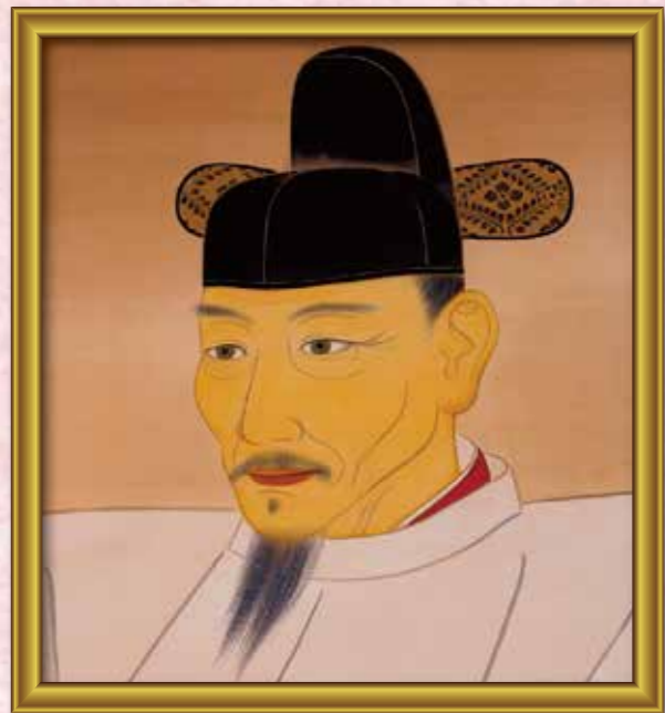
① 豊○秀○ 天下人となった武将です。