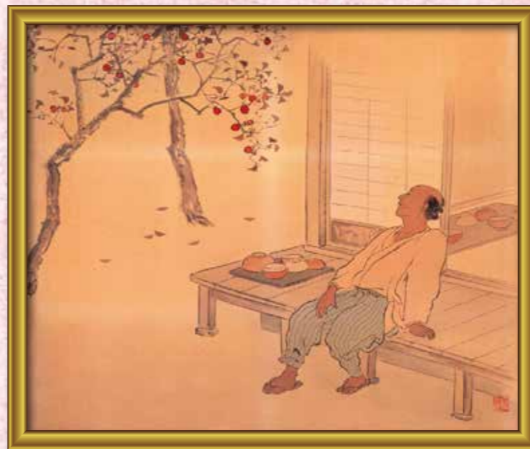
⑤ ○井田 ○右衛門 江戸時代の陶芸家です。