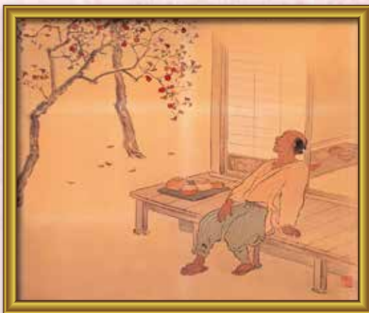
⑤ ○井田 ○右衛門 江戸時代の陶芸家です。