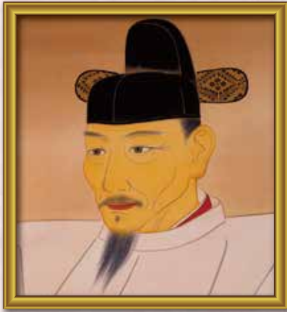
① 豊○秀○ 天下人となった武将です。