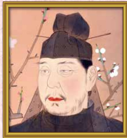
④ ○原○真 学問の神様です。