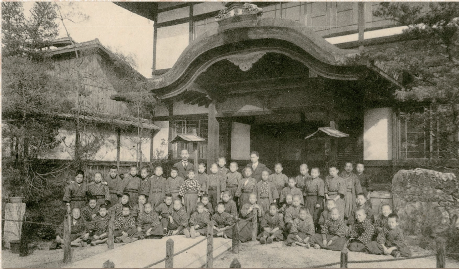
旧校舎の本館前にて 大正11(1922)年 明倫尋常小学校

開館時間：午前9時～午後5時（入館は午後4時半まで） 休館日：毎週水曜日（祝日の場合は翌平日）、12月28日～1月4日 入館料：大人200円 小・中・高生100円