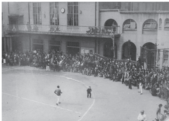
明倫学区の区民運動会 昭和22(1947)年 明倫小学校