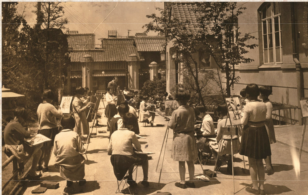
写生の授業 昭和9(1934)年 明倫尋常小学校