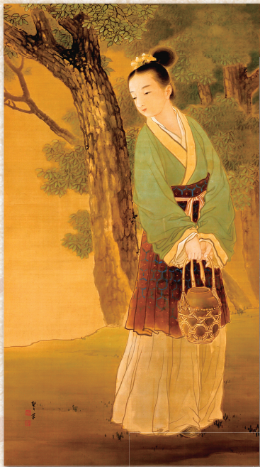
菊池契月《姜詩妻》 明治40(1907)年頃 元明倫小学校蔵