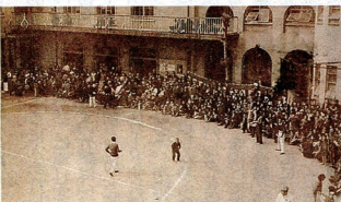
写真2、明倫学区の区民運動会の様子(明倫小運動場、1947年)

今回紹介した資料は、 学校歴史博物館(下京区)で開催する企画展「番組小学校の軌跡 下京三番組・明倫小学校のあゆみ」で展示します(31日から4月19日まで、水曜休館)。 〓 終わり