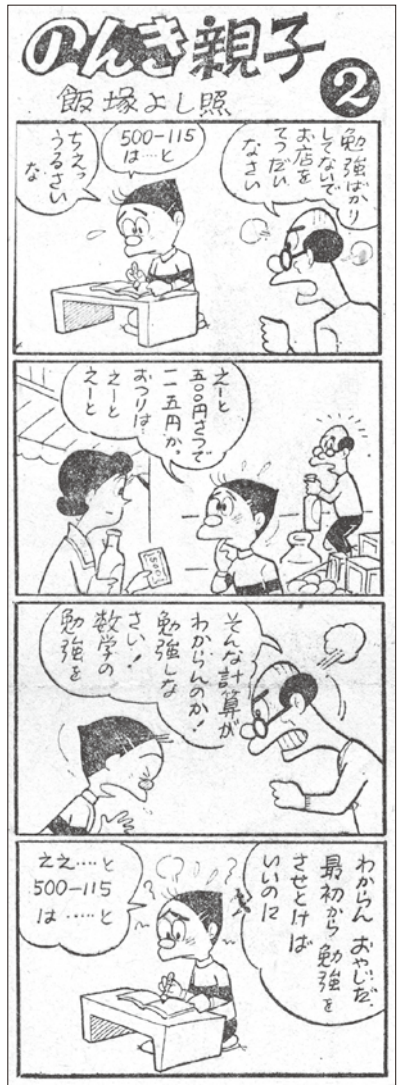
『中学時代新聞』1962 (昭和37)年4月1日号 旺文社