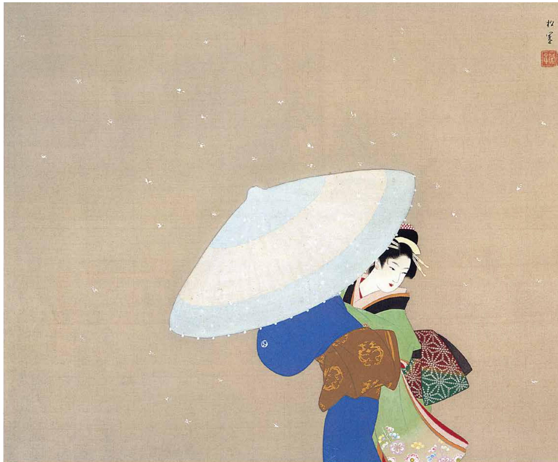
人物画 上村松園《雪》昭和15年頃 松伯美術館 前期展示

平成30年 10月6日(土)~12月11日(火) 前期10月6日(土)~11月6日(火) 後期11月8日(木)~12月11日(火)