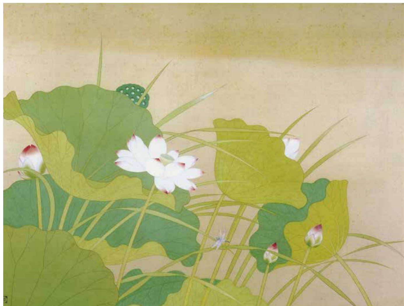
花鳥画 土田麦僊 蓮華 昭和5年