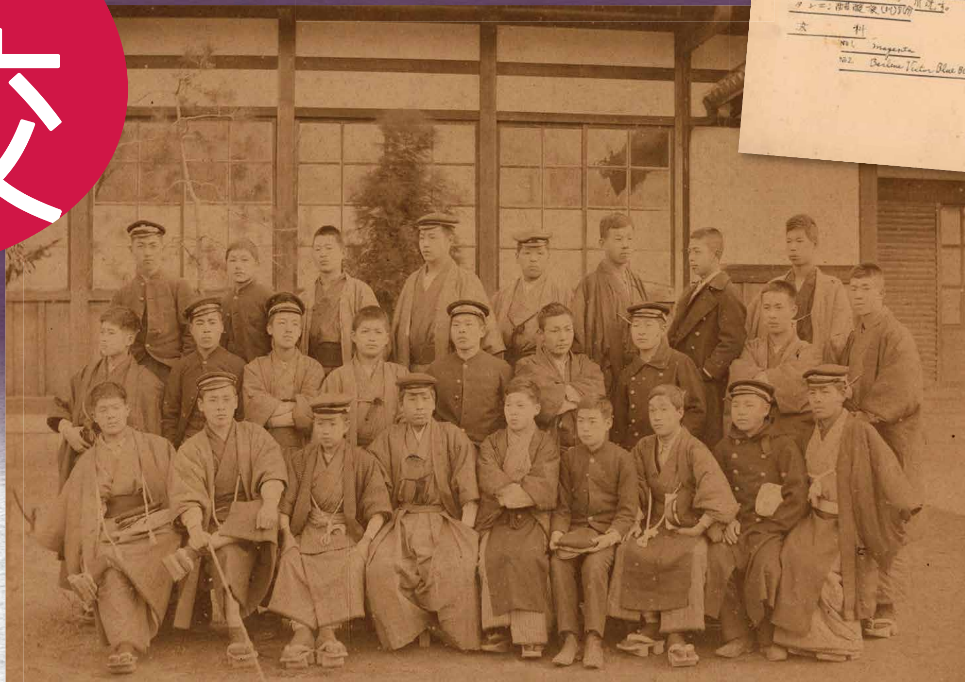
卒業写真, 1896(明治29)年, 京都府商業学校